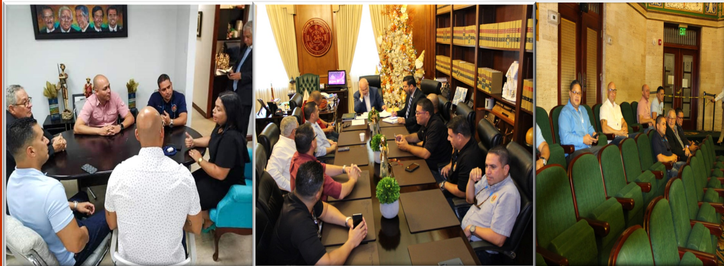
14, 18 Y 19 DE NOVIEMBRE DE 2019 - REUNIONES EN EL CAPITOLIO SOBRE EL PROYECTO 1099

Llama a La Fortaleza al 787-721-7000 Pide que la gobernadora firme el Proyecto 1099. ¡AYÚDATE!