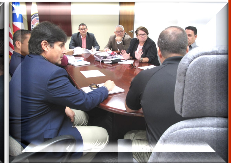
21 DE NOVIEMBRE DE 2019 - REUNION CON EL SECRETARIO