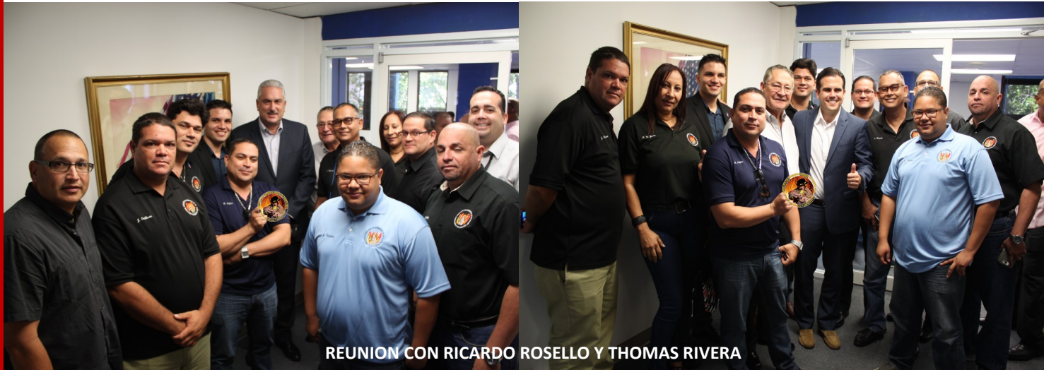
REUNION CON RICARDO ROSELLO Y THOMAS RIVERA