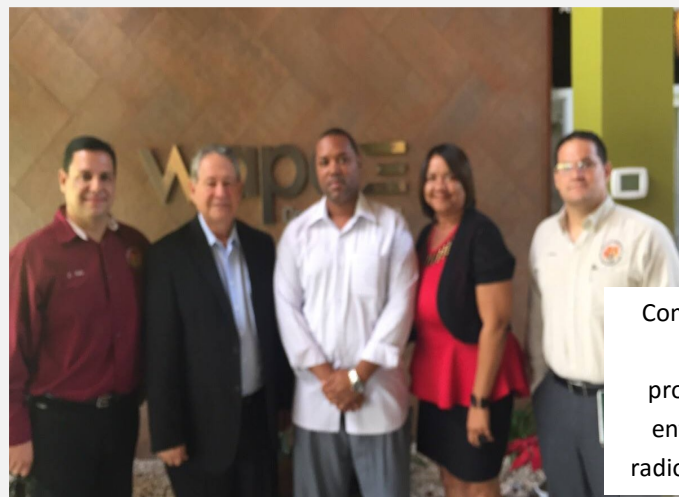
Comparecimos a varios programas de entrevista de radio y televisión